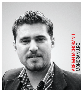
ADRIAN MONORANU MONORANU.RO

Acest lucru nu poate fi explicat decât prin numărul mare de bloguri și prin importanța pe care au căpătat-o, ceea ce i-a stimulat să creeze materiale noi. 15,77% din